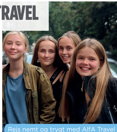
Rejs nemt og trygt med Alfa Travel